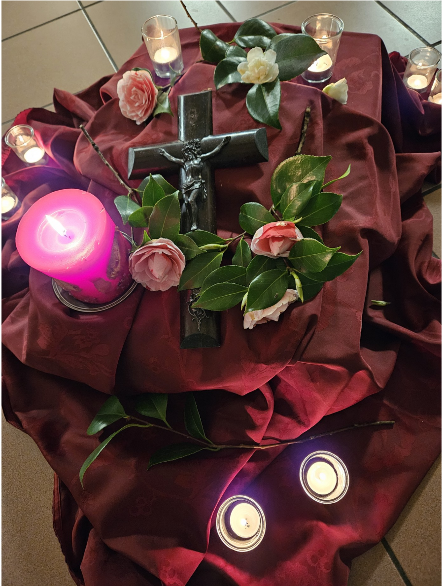
(Gestaltete Mitte einer Fröhschicht in der Fastenzeit)